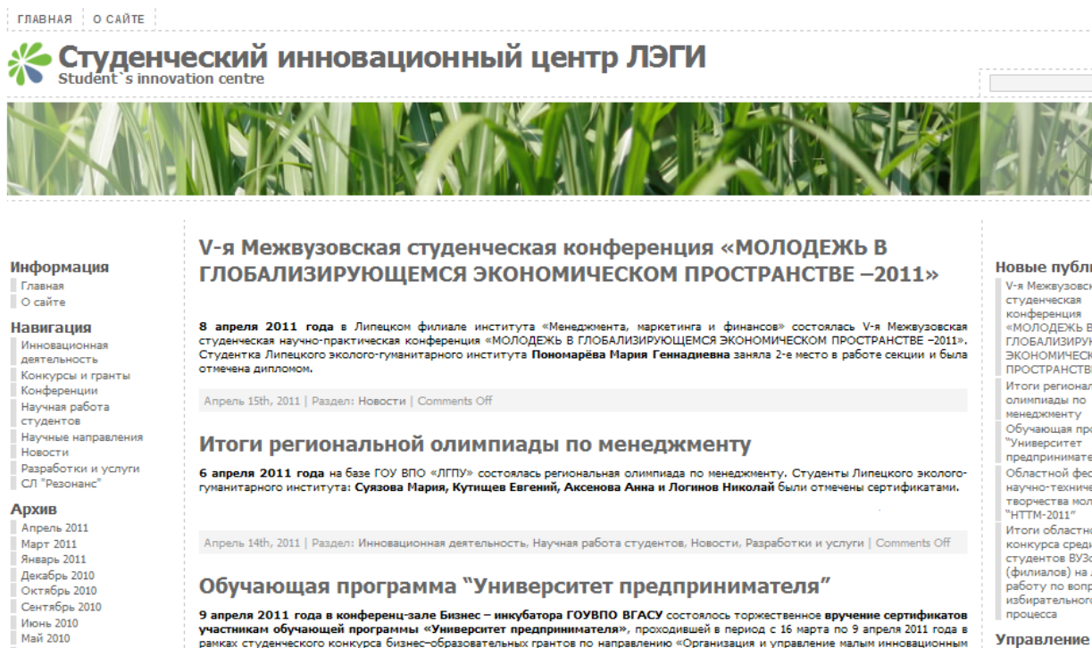
Рисунок 8. Вид страницы «О сайте» официального сайта СИЦ ЛЭГИ

В ЛЭГИ также зарегистрирован и функционирует официальный сайт студенческого инновационного центра http://www.sic48.net , на котором размещена информация о научно-исследовательской работе студентов ЛЭГИ в рамках инновационного центра, дана оперативная информация о проводимых мероприятиях, показаны студенты-победители различных конкурсов, олимпиад и др. (рисунок 8).